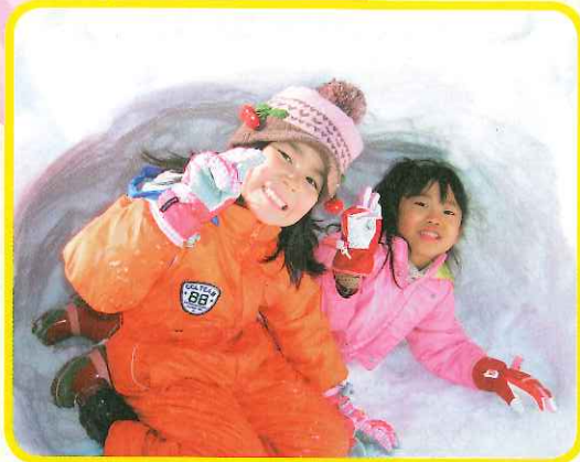
☆ 素敵な「かまくら」できました! ☆ (南城保育園の子どもたち)

花巻市では、基本的な生活習慣を身に付けるとともに、周囲の環境や人と関わりながら活動したり、経験を基によく考えて行動したりすることができる「元気な子ども」「やさしい子ども」「考える子ども」の育成をめざし、幼児期からの取り組みを進めています。