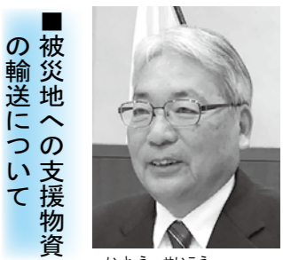
いとう せいこう 伊藤 盛幸 議員