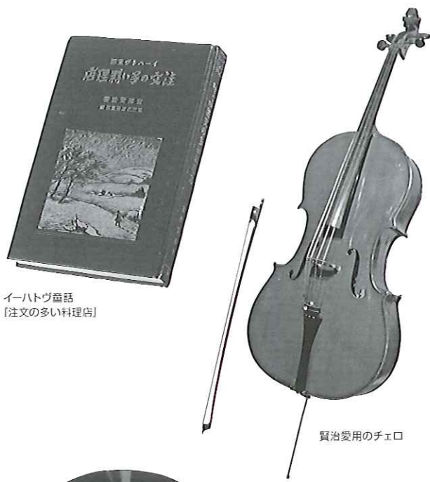
イーハトーヴ童話 「注文の多い料理店」