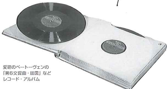
愛聴のベートーヴェンの 「第6交響曲・田園」など レコード・アルバム