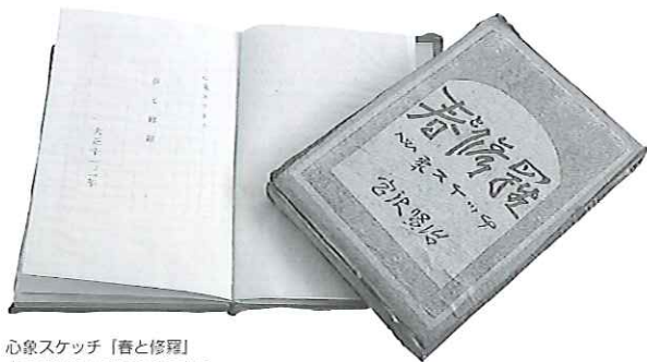
心象スケッチ「春と修理」 大正13年4月に自費で出版。