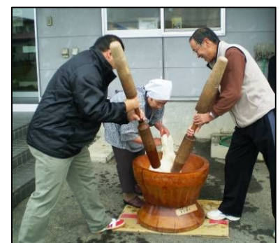
軽スポーツ大会参加者による餅つき大会