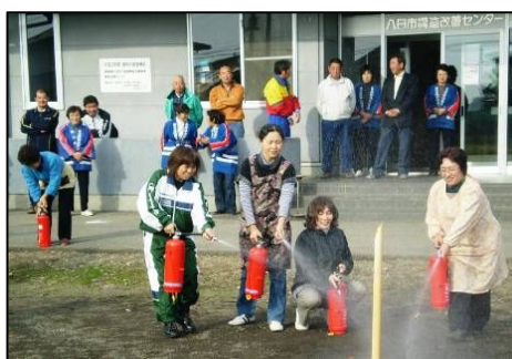
火災予防講習会(消火器の使い方)