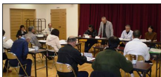
12/9に開催した 選考委員への説明会

選考委員として、各行政区長及び自治公民館長の職にある9名の方々に委嘱をし、その後選考委員の役割説明として、会長以下役員(会長、副会長、事務局長、専門部会長、監事)の選出を3月末までに選出して頂くことを説明しました。尚、選出された新たな役員については、総会において正式に決定されることとなります。