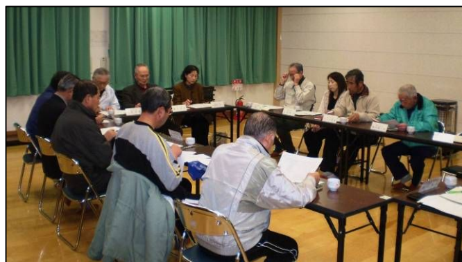
11/30に開催した 第2回役員会

また、平成20年度に作成した「八日市地区まちづくり計画(計画期間H19~H21)」について、計画の見直しを次回役員会で検討し、次期まちづくり計画を策定することとなりました。