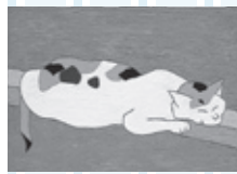
「猫」1965(昭和40)年 油彩・板 愛知県美術館(木村定三コレクション)蔵