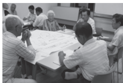
生涯学習の課題を1人1人確認（大迫地区）