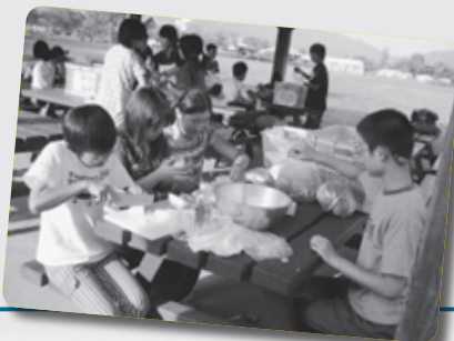
夕食は焼き肉でした