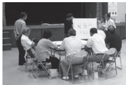
課題を解決していくための方策を発表（内川目地区）