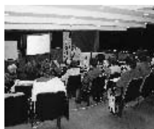
昨年度の講座の様子