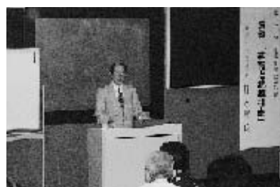
昨年度の講座の様子