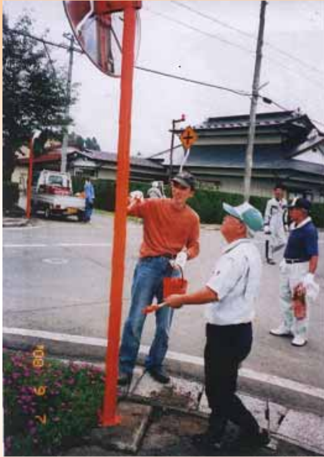
カーブミラー修繕（花南）