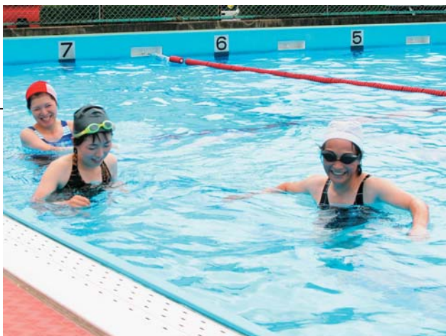
ウォーキングを楽しむ参加者の皆さん。水の抵抗で「うまく歩けない〜!」

8月23日、水中運動教室が東和地域の和池プールで開かれました。当日はあいにくの曇り空でしたが、7人の市民が参加。水中ウォーキングやビート板運動などにチャレンジしました。 肩を水面近くまで下げて歩いて、いる人の肩をもつ一人がつかんで、足を浮かせる「飛行機」運動では、普段あまりしたことがない動きに戸惑いながらも、二人一組になって楽しく水面を動き回りました。 プールに入るまでは表情の硬かった皆さん。コーチのハキハキとした指導で次第に笑みがこぼれ、会場はにぎやかな雰囲気になりました。気持ちいいプールの中で、皆さんも体もリフレッシュしたようです。