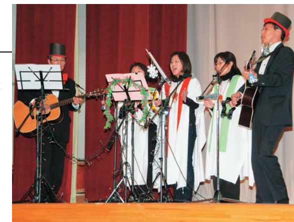
もうすぐクリスマス。一足早く歌で会場を盛り上げました(大迫地域)

12月2日と3日の両日、花巻・大迫・石鳥谷・東和の各地域で歳末助け合い芸能(演芸)大会が行われました。石鳥谷中央公民館で開催された演芸大会には約40団体が出演。次々と舞台上で演じられる舞踊やダンス、合唱などを大勢の観客が楽しみました。各地域の大会の入場券販売などによる収益金は、歳末助け合い義捐金として寄付されます。皆さんの思いやりで温かく迎えた年の瀬。来年も互いに助け合いながら、すてきな一年にしたいですね。