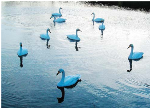
小山田の軽井沢堤にはもう数羽の白鳥が飛来し、羽を休めていました(11月23日)