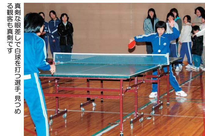
真剣な眼差しで白球を打つ選手。見つめる観客も真剣です

参加者の親睦と卓球技術の向上を図るため、第30回大迫町少年卓球大会が、11月26日、大迫体育館で行われました。団体戦1チーム3人)には男子7チーム、女子5チームが、個人戦には男子18人、女子20人が参加。互いに交流を深めながら熱戦を繰り広げました。真剣に白球を追いかける選手たち。鋭いドライブやスマッシュが決まるたびに、観客からは大きな歓声が上がっていました。選手たちの熱気と、応援に駆けつけた皆さんの熱い声援。会場全体がひとつになり、大いに盛り上がりました。