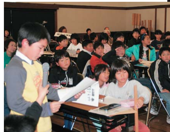
▲研究発表を聞いて自分の意見を発表。考える力を養いながら、学校間の相互交流も図りました

12月1日、とうわ子どもサミットが東和総合福祉センターで開催されました。サミットには、教育委員会東和事務所管内の8小中学校から約150人の児童と生徒が参加。総合学習の時間に調査活動した成果を学校ごとに発表しました。各校の発表を聞いて、子どもたちは自分の意見を積極的に発言。質疑応答を通して発表する力、考える力を高め合いました。ほかの学校の発表から気付くことはたくさん。子どもたちは、学校を越えて交流しながら知識も深めていきました。