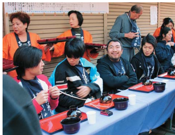
「何杯食べられるかなあ」。すずらん通り商店街で行われたわんこそば大会に挑む皆さん

「ふるさと花巻まるごとPR事業」は11月10日から12日まで、東京都杉並区南阿佐ヶ谷のすずらん通り商店街で開催されました。商店街では、本市の特産品販売やわんこそば大会が行われ、多くの買い物客などでにぎわいました。また、11月25日には、南阿佐ヶ谷すずらん商店街振興組合の組合員13人が本市を訪れました。滞在中、組合員の皆さんは南部杜氏伝承館や地元の酒造店などを見学。石鳥谷町観光協会の役員などと情報交換しながら交流を深めました。旧石鳥谷町で平成14年度から行っているこの催しも、合併によりその幅が広がりました。これから本市の特産品のPRや、各地域との新たな交流の輪の広がりが期待されます。