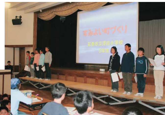
地域の水道水の仕組みなど、1日3時間の研究成果を発表した浮田小学校の皆さん