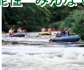
東和 猿ヶ石川 川下りボートレース