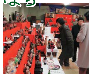
大迫 宿場のひなまつり