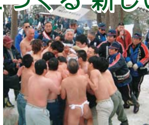
石鳥谷 五大尊蘇民祭