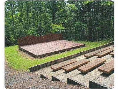
野外ステージ・スタンド

この森は、神奈川県平塚市と花巻市の友好都市提携を記念して整備されたものです。森の中には、たくさんの種類の樹木が植栽されており、森林浴や自然探索ができる歩道や水辺があります。また、テントサイトや炊事施設を備えたキャンプ場もあります。