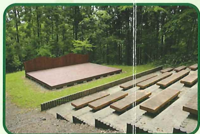
野外ステージスタンド