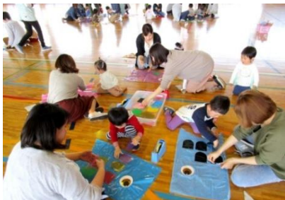
たくさんのお友達と一緒に作りました。

● 毎月1回さまざまな内容でイベントを企画しています。 ● 4月22日(月)「こいのぼりをつくろう」には18組 ● 37名の参加があり、笑顔いっぱいの素敵な時間を ● 過ごすことができました♪