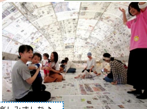
後半は各コーナーあそびを楽しみました♪