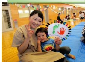
新聞ドームコーナー