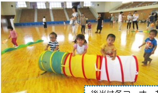
サーキットコーナー