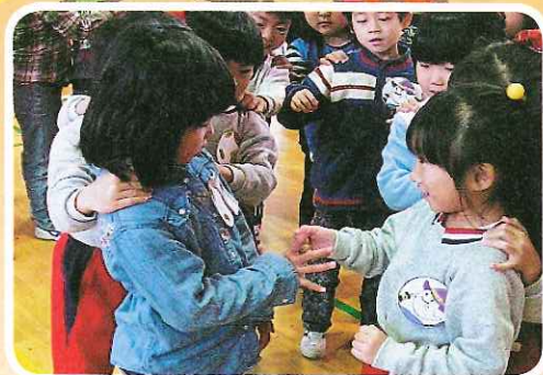
「じゃんけんポン」湯口大谷幼稚園・湯口保育園・湯口小学校の子どもたちが交流しました。

花巻市では、「市の宝物」である子どもたちの健全な育成のために、子どもを取り巻く環境を整える取り組みをしています。