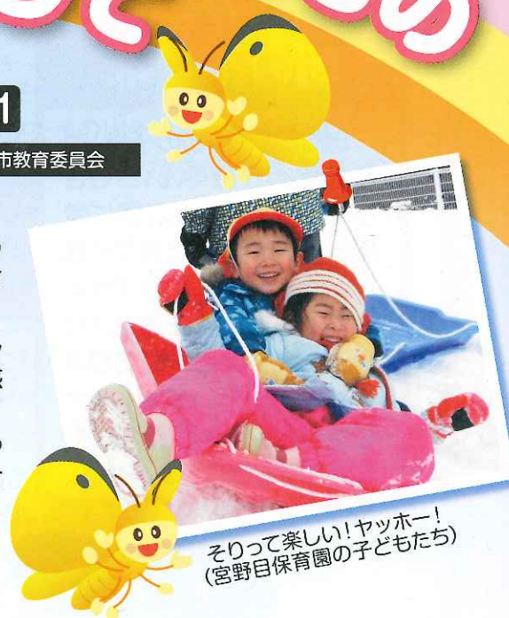
そりって楽しい! ャッホー! (宮野目保育園の子どもたち)