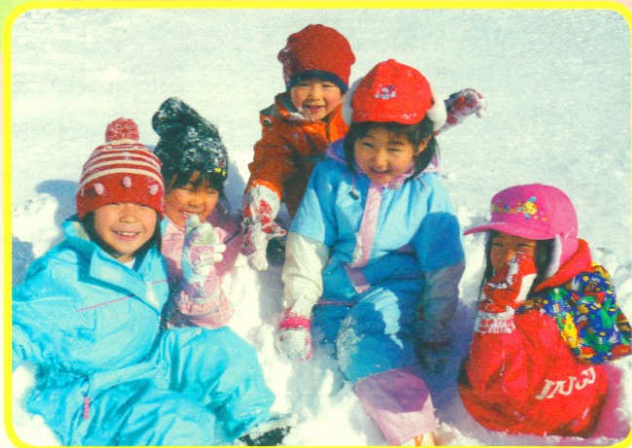
「雪と友だち、湯口っ子」 湯口保育園の子どもたち