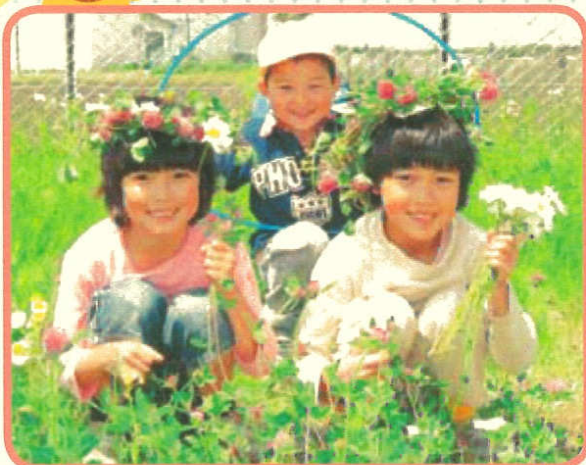
「気分はお姫様♥」 亀ヶ森保育園の子どもたち

花巻市では、基本的生活習慣を身に付けるとともに、周囲の環境や人と関わりながら活動したり、経験を基によく考えて行動したりすることができる「元気な子ども」「やさしい子ども」「考える子ども」の育成をめざし、幼児期からの取り組みを進めています。