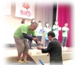
湘南ベルマーレのグッズを頂戴しました！

10月15日(日)、気温も涼しくまさにマラソン日和というお日柄のもと、イーハトーブレディース駅伝が開催されました。友好都市2市からも選手が参加し、花巻の街を颯爽と駆け抜けました。平塚市から参加の「ひらつかレディース」はレディース部門で13位、十和田市から参加の「はねこま スマイル」は同部門で10位と、両チームとも大健闘のご活躍でした！花巻走友会もシニアレディース部門で3位という好成績を収めました。選手の皆さん、大変お疲れ様でした！ぜひまた花巻にいらしてください。