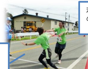
たすきに 想いを託し 次の走者へ！