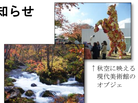
↑秋空に映える現代美術館のオブジェ

ご好評を頂いております「友好都市十和田訪問市民ツアー」について、今年度の最新情報をお届けします！日程は平成30年10月27日(土)、申込は平成30年9月15日から10月3日まで受付です。募集記事は、「広報はなまき」9月15日号に掲載します。また、市役所やまなび学園、振興センターなど市内各施設にてチラシを配布します。秋真っ盛りの十和田市を訪れてみませんか。詳しくは広報はなまき、または当委員会のホームページをご覧ください。