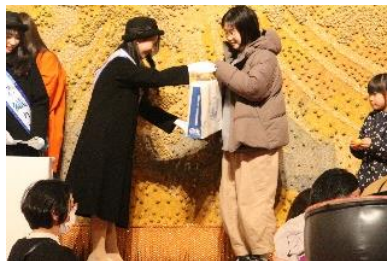
抽選会で平塚市の景品を渡す様子