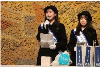
抽選会で平塚市をPRする織り姫さん