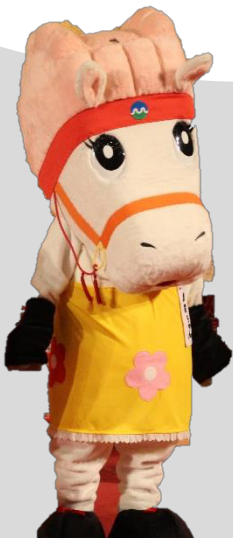
十和田市のゆるキャラ 「駒桜(こざくら)ちゃん」