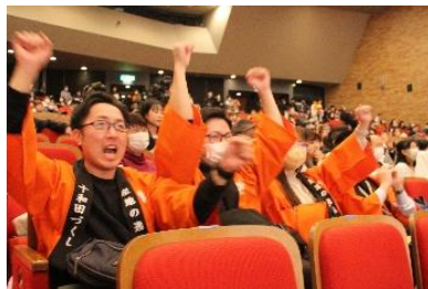
食士を応援する十和田市応援団