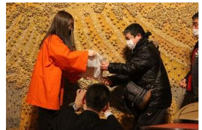
抽選会で十和田市の景品を渡す様子