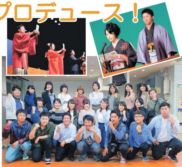
▲昨年度は28人の実行委員の皆さんがアイデアを出し合い、記念行事の準備を進めました

応募方法 9月5日(水)までに電話で下記へ 問い合わせ・応募 本館生涯学習課(☎24-2111内線401)