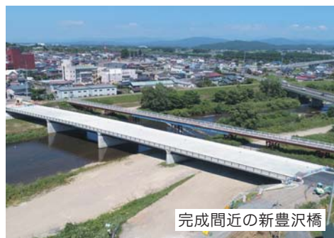
完成間近の新豊沢橋