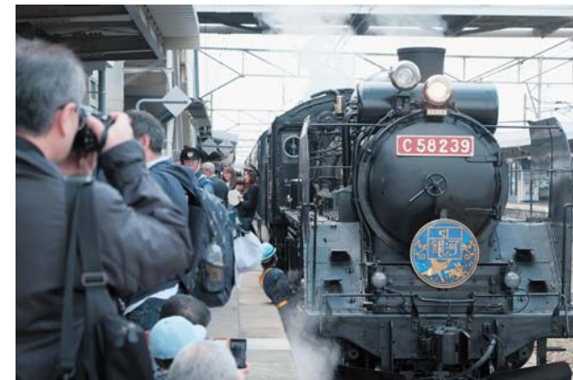
昨年の運行開始式。多くのSLファンが見守りました

【問い合わせ】イーハトース花巻ハーフマラソン大会実行委員会 (本館スポーツ振興課内 ☎24-2111内線296)