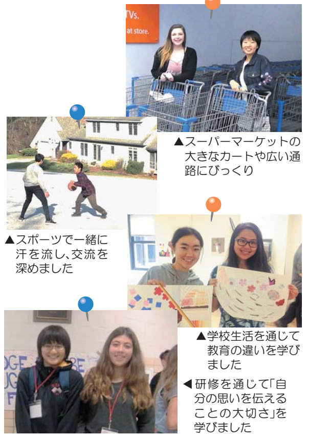
▲スーパーマーケットの大きなカートや広い通路にびっくり

本市の中・高校生32人が、平成29年10月末から11月初旬にかけて姉妹・友好都市などの関係にある▶アメリカ合衆国ホットスプリングス市▶同ラットランド市▶同クリントン村▶オーストラリア共和国ベルンドルフ市への4都市へ、派遣されました。 うち中学生の皆さんは「双方の学校の違い」や「相手国の音楽文化」「コミュニケーションの取り方」など、それぞれのテーマを持ってホームステイや学校での生活を体験。多くの交流や経験を通じ、国際交流に対する意識や関心を高めました。 ことしも10月末に青少年海外派遣研修を実施予定。4月に市内の中学2年生を対象に募集を行います。 海外の文化を学ぶチャンスでもある同研修。多くの皆さんの応募をお待ちしています。