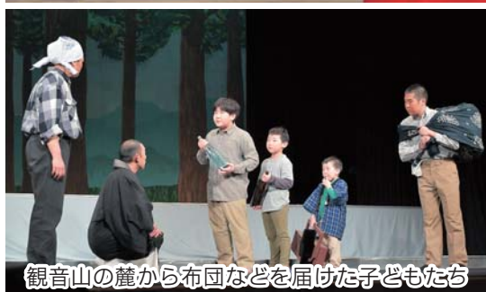
観音山の麓から布団などを届けた子どもたち