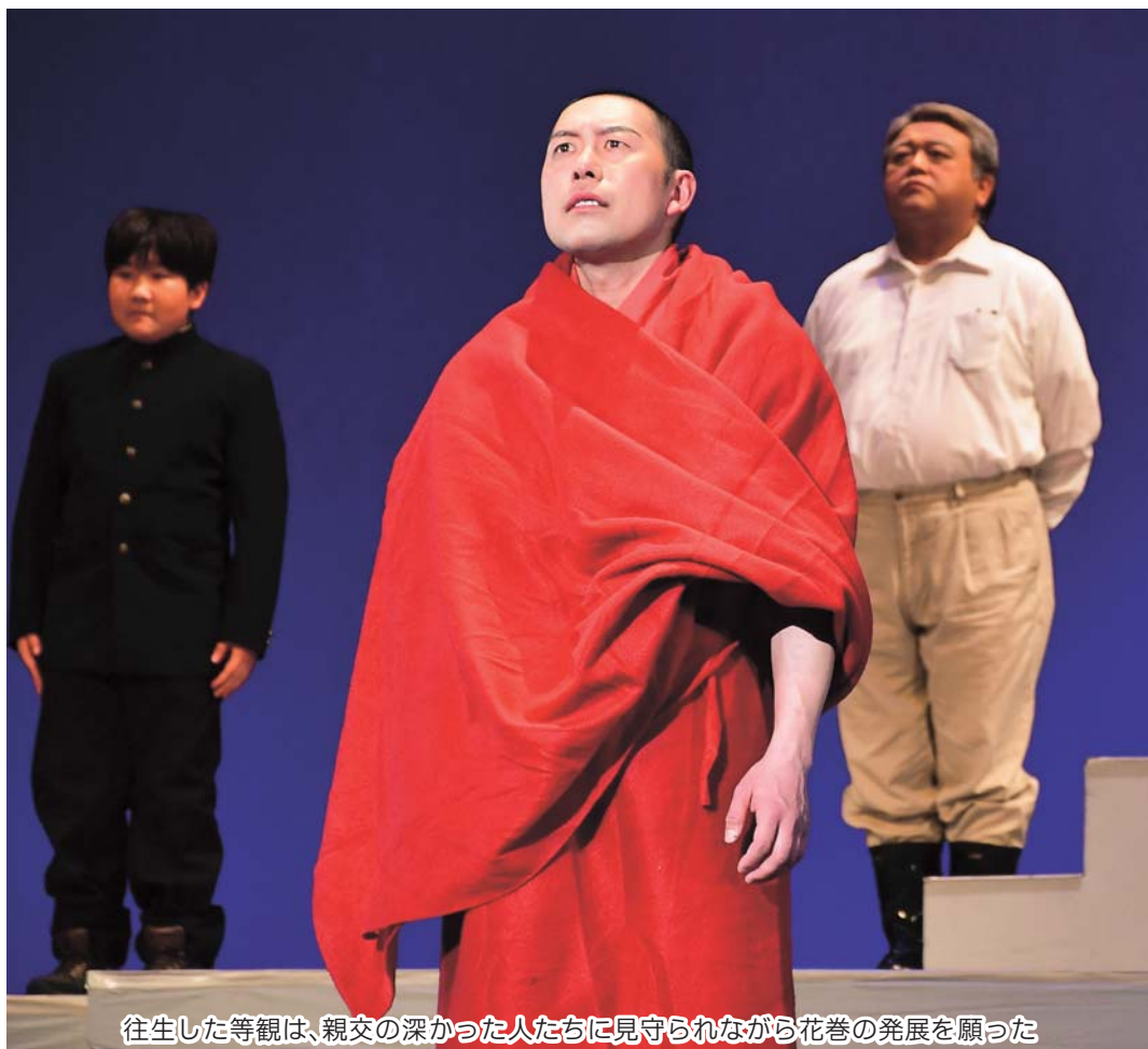
往生した等観は、親交の深かった人たちに見守られながら花巻の発展を願った