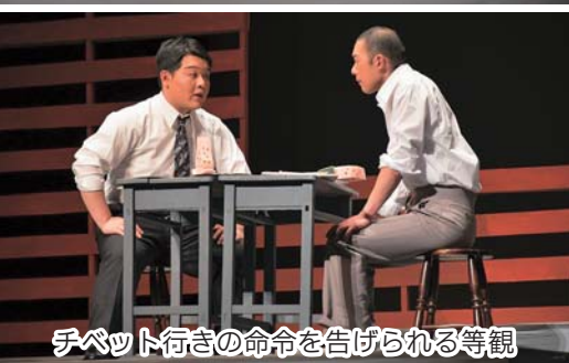
チベット行きを命ぜられる等観