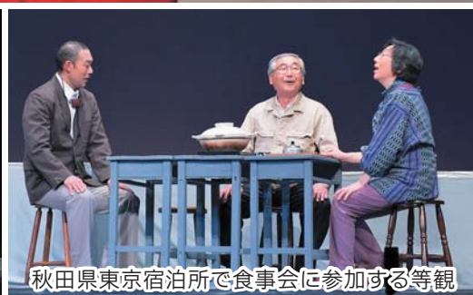
秋田県東京宿泊所で食事会に参加する等観