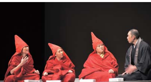
方言で日本語を学ぶチベット僧侶たち

Public Relations Magazine 広報はなまき—No.281 平成30年[2018] 3月15日発行