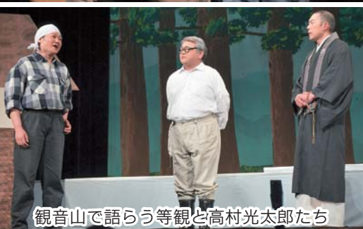
観音山で語らう等観と高村光太郎たち