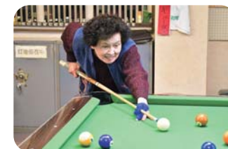
「手玉のコントロールが難しいところ」と話し、集中力を高めてスレーする会員。随時、会員を募集しています。