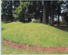
(左)上根子にある熊堂古墳群[市指定史跡] 玉類や刀剣類など、数多くの副葬品が出土 (右)熊堂古墳群から出土したガラス小玉[花巻市博物館蔵]