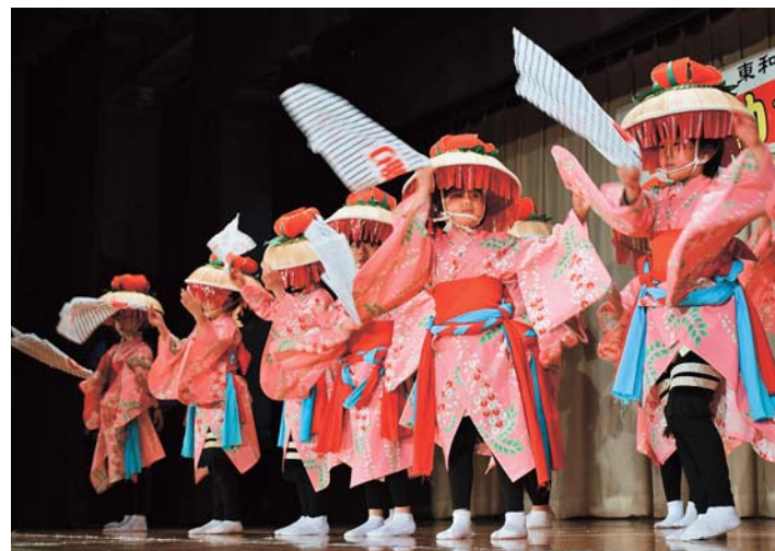
倉沢サンサ踊りを披露する子どもたち