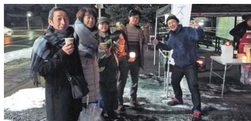
「寒さにも負けずカnpaiイ」

私の地域おこし協力隊の任用期間はこととして終わるため、ミズベリング活動の総まとめとして市民の皆さんと楽しめる大堰川プロムナードのイベントを計画しています。ぜひ、今後のミズベリング花巻の活動にご期待ください。