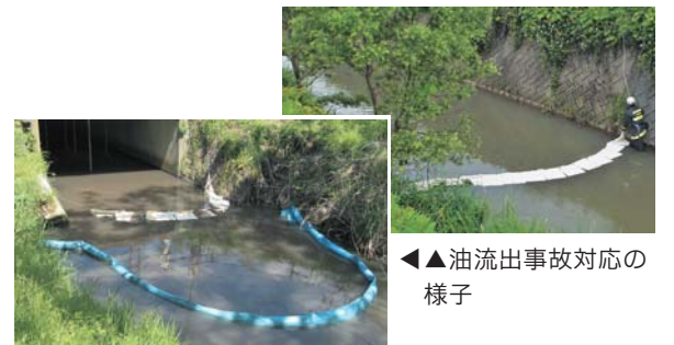
◀油流出事故対応の様子

●漏れた油の処理・回収には多額の費用がかかる場合があります。その費用は全て原因者の負担となります(数十万円かかる場合もあります)。万が一、油を流出させてしまった、または流出しているのを発見した場合は、本庁生活環境課または各総合支所市民生活係、最寄りの消防署へ連絡してください。