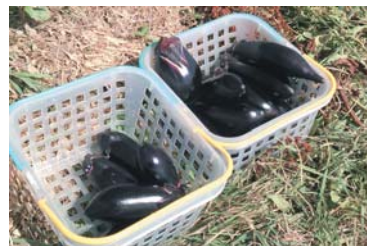
◀8月ごろ収穫したナス

着任から2年が過ぎ、いよいよ協力隊任期の終わりが見えてきました。私は今、東和町での農地貸借の手続きを進めています。昨年の夏に就農を決意し、11月ごろから農地や住宅を探し始