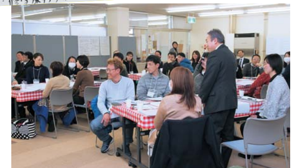
(写真)2月7日に花巻市交流会館で行われた東ブロックの第2回会議の様子。さまざまな意見が出されました