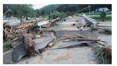
▲猿ヶ石川上流の被害状況

■猿ヶ石川の水位を低減 台風10号接近時、田瀬ダムでは、昭和29年の竣工以来、62年間で2番目に大きい毎秒1050立法ト(※)の洪水が流入。ドーム約11個分に相当