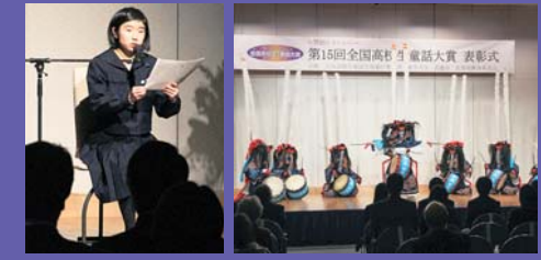
※写真は昨年度の様子