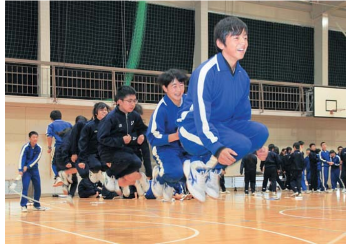
息を合わせて長縄を跳ぶ両校の生徒たち