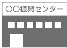
● 振興センター など