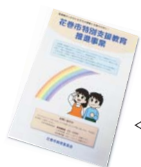
特別支援教育リーフレット