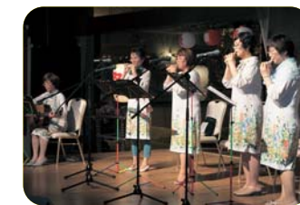
コンサートで演奏する会の皆さん。美しい音色を響かせました

現在のメンバーは50代〜70代の女性5人。童謡や歌謡曲、クラシックなど、さまざまなジャンルをギター伴奏に合わせて演奏します。 ステージでは音色の異なるオカリナを使い分けた重奏を披露する皆さん。「練習の成果を発表する場として、ステージに立つことがとても楽しい」と話します。