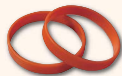
▲認知症サポーターの目印「オレンジリング」

認知症サポーターとは、何か特別なことをする人ではありません。講座で正しい知識を習得し、自分のできる範囲で認知症の人を応援するのが認知症サポーターの役割です。