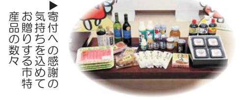
寄付への感謝のお気持ちを込めてお贈りする市特産品の数々