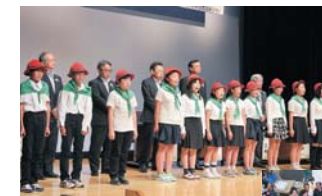
▲うすゆき草サミットで記念メッセージを読み上げた参加者たち