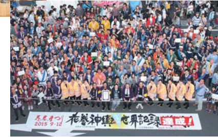
▼一つの会場でお披露目するみこしの数でギネス世界記録を達成し、喜びを分かち合う関係者たち