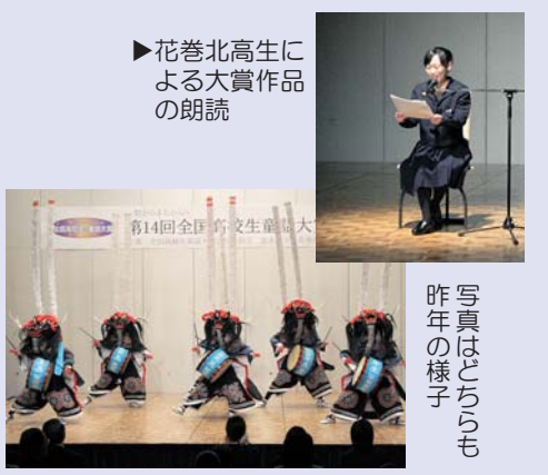
▶花巻北高生による大賞作品の朗読