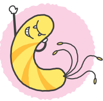
ピロリ菌イメージ

20歳、25歳、30歳、35歳、40歳の市民を対象にピロリ菌 の無料検診を開始します(年齢は平成28年3月31日 時点)。ピロリ菌の感染が確認されたら、早めの除菌 治療をお勧めします。