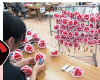
◀軒花が会場を華やかに彩ります