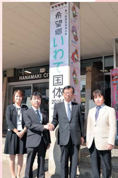
▲柱に設置されたPRシートが、来庁者の目を引き付けています

市役所本庁玄関前の柱に設置したこの装飾シートにより、国体に向けた機運の盛り上がり期待されます。