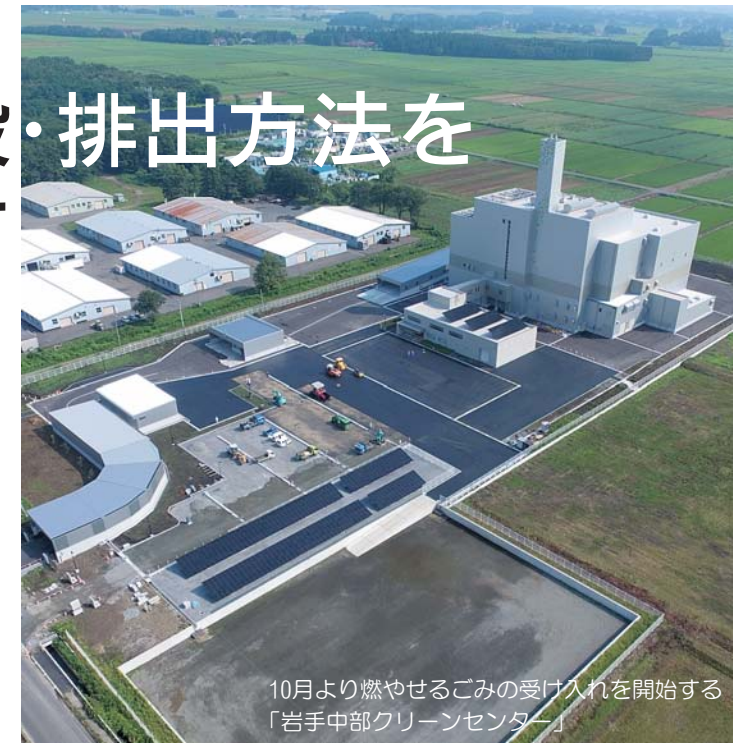
10月より燃やせるごみの受け入れを開始する「岩手中部クリーンセンター」

花巻市・北上市・遠野市・西和賀町で構成する岩手中部広域行政組合により建設が進められていた新焼却施設「岩手中部クリーンセンター」が完成し、10月から稼働します。