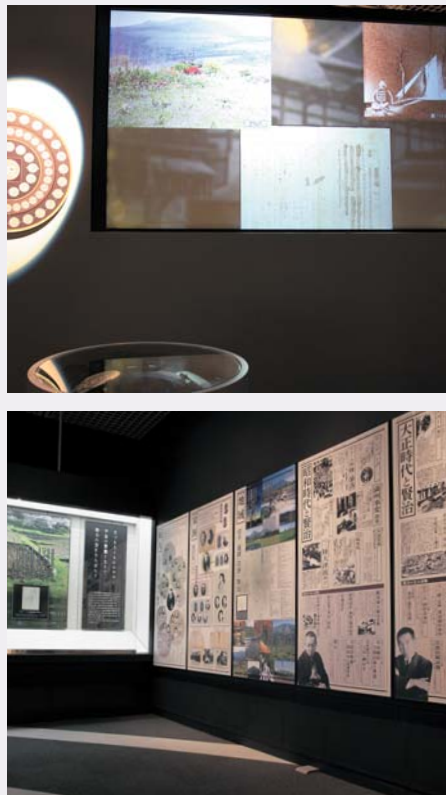
宮沢賢治の心象世界へといざなう大型スクリーンを新たに導入。展示解説パネルも大きくなり見やすくなりました