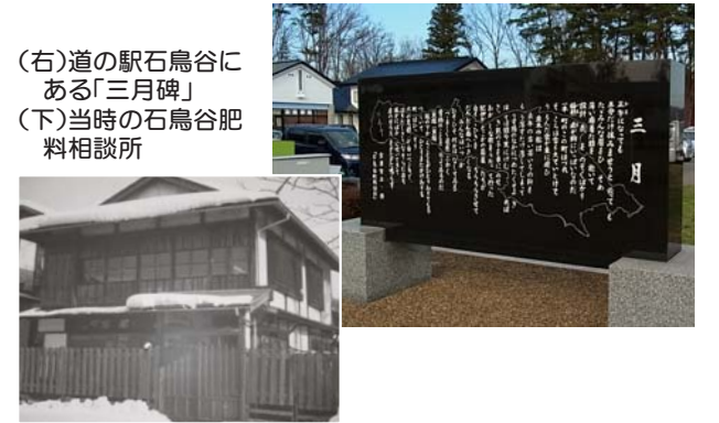
(右)道の駅石鳥谷にある「三月碑」 (下)当時の石鳥谷肥料相談所

道の駅「石鳥谷」構内には、賢治が旧石鳥谷町内で行った稲の肥料相談の様子をつづった詩「三月」が刻まれた碑があります。 平成18年に石鳥谷賢治の会によって建立されたもので、詩碑の前では、毎年3月5日に詩の朗読や合唱を通じて賢治をしのぶ「賢治三月祭」が開催されています。 詩「三月」の舞台となったと考えられる石鳥谷肥料相談所は、「塚の根肥料相談所」と称し、現在の花巻商工会議所石鳥谷支所の斜め向いにある書かれた説明板と地域住民の活動拠点施設「石鳥谷・宮沢賢治塚の根」があります。 賢治のまな弟子であった菊