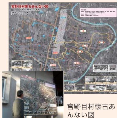
【問い合わせ】宮野目コミュニティ会議(☎26-2111)

発展を実感するなど、多くの再発見をしています。また小中学生には、歴史の教材として活用してもらうことで、現在の生活の礎を築いた先人に対する畏敬の念を呼び起こし、郷土愛を育む契機になればと期待しています。 本年度は史跡へのQRコード付き標柱の設置を進めています。今後も本事業を推進し、宮野目の歴史や文化を知る機会を設けることで地域の誇りと郷土愛の醸成を図ります。