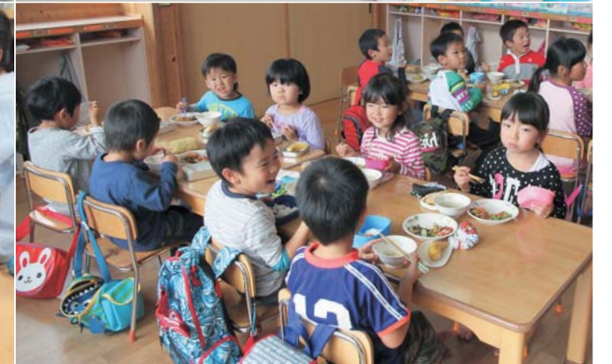
(左上)子ども同士の話し合いの様子〔花巻幼稚園〕、(右上)子育て相談の様子〔こどもセンター〕、(左下)3歳未満児の保育の様子〔二枚橋保育園〕、(右下)給食の様子〔成島保育園〕