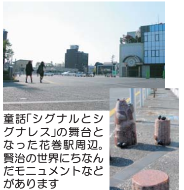
童話「シグナルとシグナレス」の舞台となった花巻駅周辺。賢治の世界にちなんだモニュメントなどがあります

なはんプラザでは、建物北側に設置された、童話「銀河鉄道の夜」をモチーフにした「からくり時計」「銀河ポップ」が軽やかな音楽を奏でます。午前