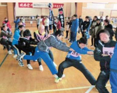
「百人綱引き大会」では力を合わせて勝利を目指しました

回百人綱引き大会」は、花西地区内7行政区のトーナメント戦で競技を行い、連覇を狙うチームや応援賞獲得に向けてさまざまな工夫を凝らすチームなど、いままで以上の盛り上がりを見せました。今後、地域課題の解決や住民の要望に応える事業に取り組み、「安全・安心」の明るく活気あるまちづくりを進めていきます。