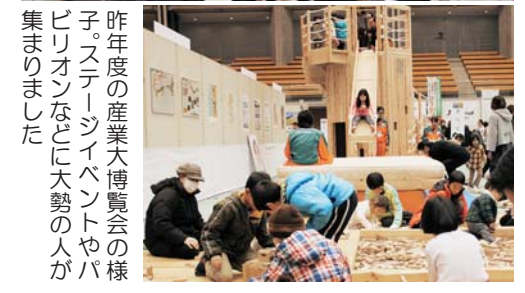
昨年度の産業大博覧会の様子。パビリオンなどに大勢の人が集まりました。