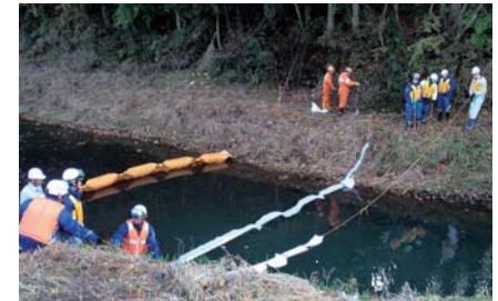
▲北上川水系水質汚濁対策連絡協議会が主催した水質事故訓練の様子

万が一、油を流出させてしまった、または流出しているのを発見した場合は、本庁生活環境課または各総合支所生活福祉係、最寄りの消防署、県企業局県南施設管理所(☎0197-66-3233)に連絡してください。