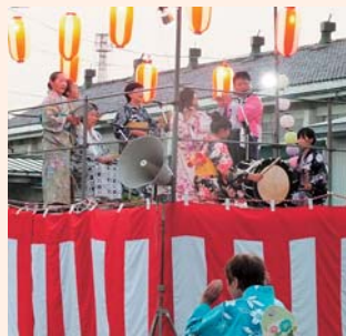
にぎやかに開催された笹間地区の盆踊り大会

8月15日、会場となったJAいわて西南カントリー前の広場には、開始時間前から大勢の皆さんが来場。会場中央のやぐらにつるされたちょうちんに明かりがともされ、午後6時、盆踊り大会が開演しました。