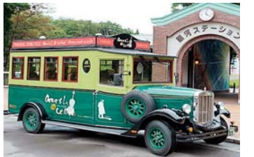
レトロな雰囲気の車両で市内を巡ります

大迫交流活性化センターと花巻温泉郷・花巻駅を往復する「神楽号」も運行(12月・1月を除く)。いずれも3日前までの予約が必要です。大正ロマンに浸りながら、一味違う小旅行に出掛けてみませんか。 ●運行期間 10月1日～平成26年3月31日(12月28日～1月4日を除く) ●料金 ▽半日コース500円/人▽1日コース・神楽号1000円/人 ※ツアー料金に施設入館料、昼食代は含まれません ●予約先 いわて花巻旅行社(☎37-2118) ●問い合わせ 一般社団法人花巻観光協会(☎29-4522) 【問い合わせ】 本庁賢治まじゅり課 (☎24-2111内線365)