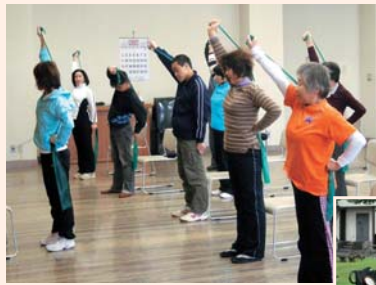
▼今年の7月に開催した「ウオーキング教室」

本年度はさらに地域住民の要望で「ウオーキング教室」も開催。秋にはグラウンドゴルフ大会やスポーツ交流会を予定するなど、幅広い年代の方が、楽しく交流しながら健康づくりができるように取り組んでいます。今後も、生涯現役のまちを