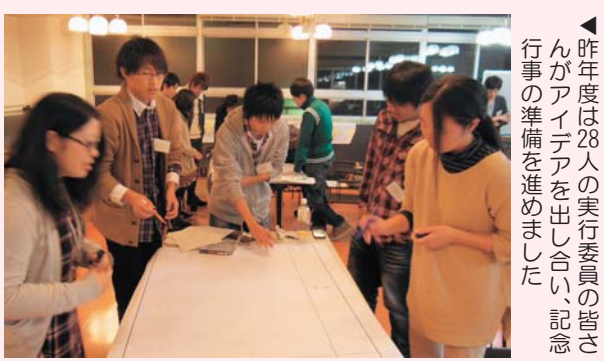
▲昨年度は28人の実行委員の皆さんがアイデアを出し合い、記念行事の準備を進めました