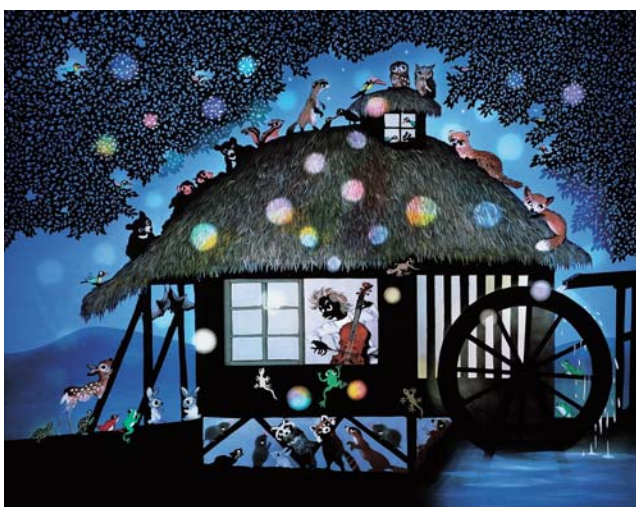
『ゼロ弾きのゴーシュは動物病院のお医者さん』2012年 © Seiji Fujishiro/HoriPro

■日時 9月7日(土)～11月17日(日)、午前9時～午後4時(9月7日は午前10時開場) ■会場 花巻市博物館 ■前売り券 ▽一般 大学生1000円(当日1200円) ▽小・中・高生500円(当日700円) ※①～⑥の場合、前売り料金で入場できます。①10人以上の団体 ②障がい者手帳の提示で本人と介助者1人③本市発行のまなびキャンパスカード(ふるさとパスポート)を提示④市内高校の学生証(市外高校でも市内在住者は可)を提示⑤富士大学生証を提示⑥宮沢賢治記念館、宮沢賢治童話村、花巻新渡戸記念館の入場券・共通券半券を提示 ■市内プレイガイド イトーヨーカドー花巻店、なはんプラザほか 藤城清治サイン会 ■日時 9月21日(土)・22日(日)、10月5日(土)・6日(日)、11月4日(月)・振替休日・10日(日)・16日(土)、午後1時30分 ※詳しくは、会場でご確認ください 【問い合わせ】 花巻市博物館(☎32・1030)