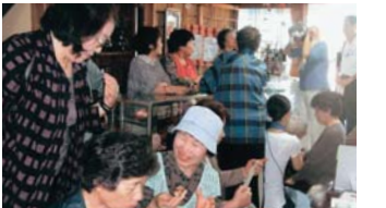
(写真上)休憩所では笑顔と交流の輪が広がります(写真左)庭にある「月夜の電信柱」の前は、人気の写真スポットです

もその風景や歴史、賢治とのつながりが伝わるようにと、もてなしに工夫を重ねている会の皆さん。心のこもった対応に「旅の疲れが癒やされた」と感謝の言葉が多く寄せられています。 ことしも「くろみの森」はもうすぐオープン。賢治が耳を傾けた北上川のせせらぎとすてきな「おかあさん」たちに会い、出掛けてみませんか。イギリス海岸の新たな魅力を発見できるかもしれませんよ。 ■ことしの開所期間 4月29日～10月中旬、火曜日・木曜日を除く毎日 ■開所時間 午前10時～午後4時 【問い合わせ】本庁賢治まちづくり課(☎24-2111 内線365)