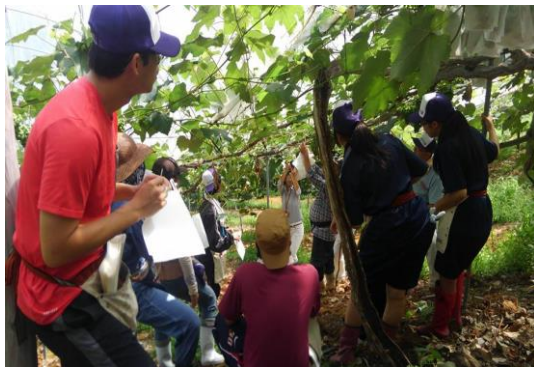
ぶどう栽培を手伝う 「ぶどうつくり隊」