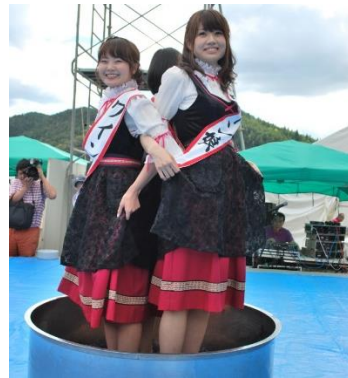
イベントでぶどう踏みをする ワイン娘