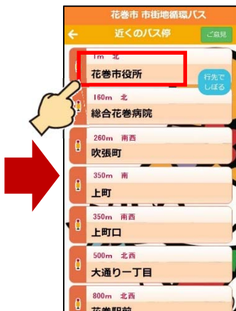
近くのバス停を表示