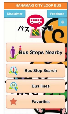
英語版のトップ画面