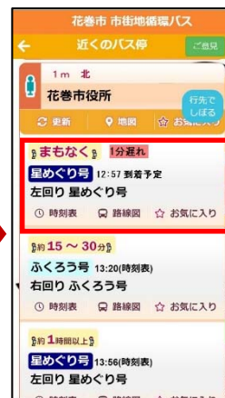
選択したバス停の 到着予測時間を表示