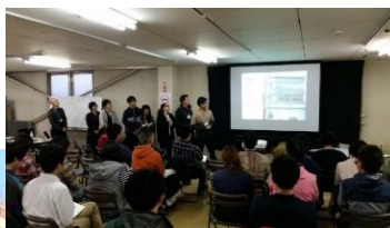
スクールで発表された不動産

昨年度10月6日から8日まで3日間、マルカンビル7階で行われたリノベーションスクールでは、応募35人から選考された24人が3つのユニットに分かれ、それぞれの遊休不動産を活用したビジネスプロジェクトを考案し、不動産オーナーに向けて発表しました。ここで得た学びを糧に、参加者が自らリノベーション事業をスタートさせています。